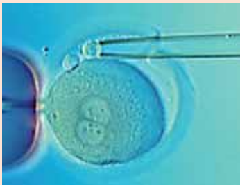
Spezielle Form der vorgeburtlichen Untersuchung (Polkörperdiagnostik)

einzigste Arbeitsgruppe aus Deutschland bei Cochrane veröffentlicht werden. Das ist für Mediziner mit die höchste Auszeichnung.