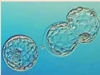
„Assisted Hatching“: Geschlüpfte Blastozyste